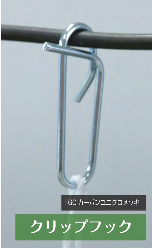
60カーボンユニクロメッキ

当社独自の仕様により一方向にしか動かない構造になっているため、特に重量のかかるトマトの長段取りには最適です。